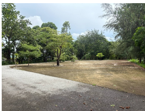
๗.ลานเบตองเทศบาลตำบลคลองวาฬ